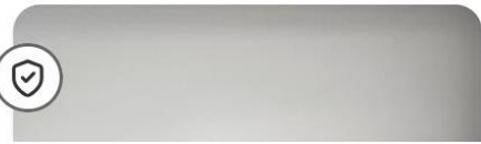
Kokeilun nimi ja toteutusaika