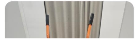
Circular Tiedepuiston kokeilujen dokumentointi